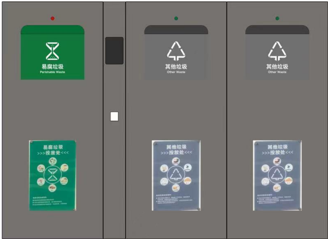
智能运行垃圾分类投放设备侧面效果图